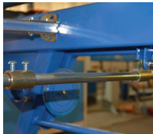
Ограничитель углагиба станка-аналога

У аналогов нет вала для радиусногогиба и нет даже возможности его установить. Получается, что оригинальный станок LBM – это станок «3 в 1», а копия – только «2 в 1».