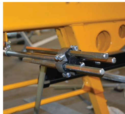
Ограничитель углагиба Metal Master

Ограничитель углагиба у аналогов имеет только одну позицию. Угол наклона каждый раз приходится регулировать. Оригинальный LBM работает в четырех позициях, которые выбираются поворотом рукоятки. Достаточно один раз настроить ограничитель и инструмент для регулировки больше не нужен!