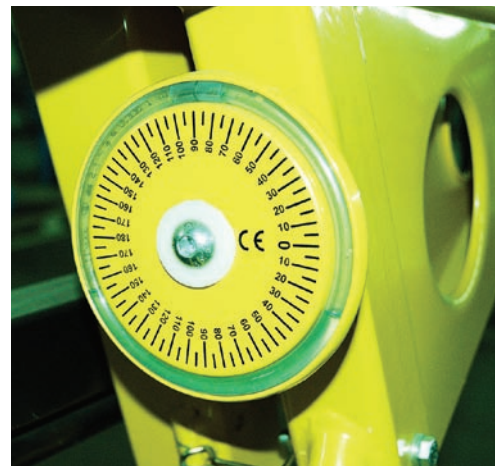
Угломер листогиба Metal Master

Еще одно непродуманное заимствование листогибов-аналогов – это угломер. Синяя жидкость на синем фоне – это ли не испы-