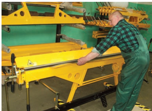
Оригинальный LBM Metal Master

Рынок станков-клонов для металлообработки также существует и его масштабы достаточно велики. К примеру, разработки марки