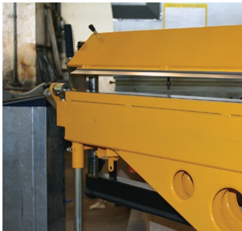
Гибочная балка Metal Master

Гибочная балка аналога сварная и состоит из трех элементов. Ее жесткость намного ниже, поэтому возможен излом по сварочному шву. Излом может образоваться и при компенсации сабельности гибочной балки, так как настройка проходит через множество сварных элементов. При этом сама настройка станка становится не эффективной.